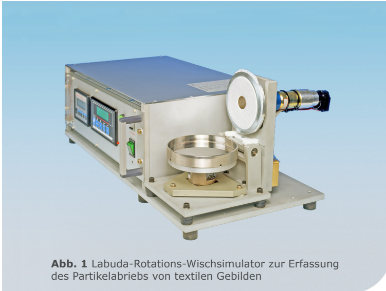
Abb. 1 Labuda-Rotations-Wischsimulator zur Erfassung des Partikelabriebs von textilen Gebilden